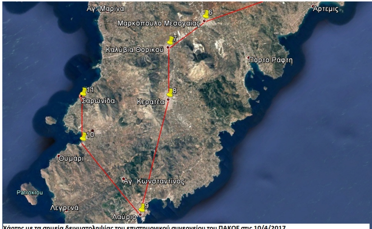
Χάρτης με τα σημεία δειγματοληψίας του επιστημονικού συνεργείου του ΠΑΚΟΕ στις 10/4/2017.

Members of: United Nations Environment PROGRAM - ECOROPA - IUCN – IFOAM